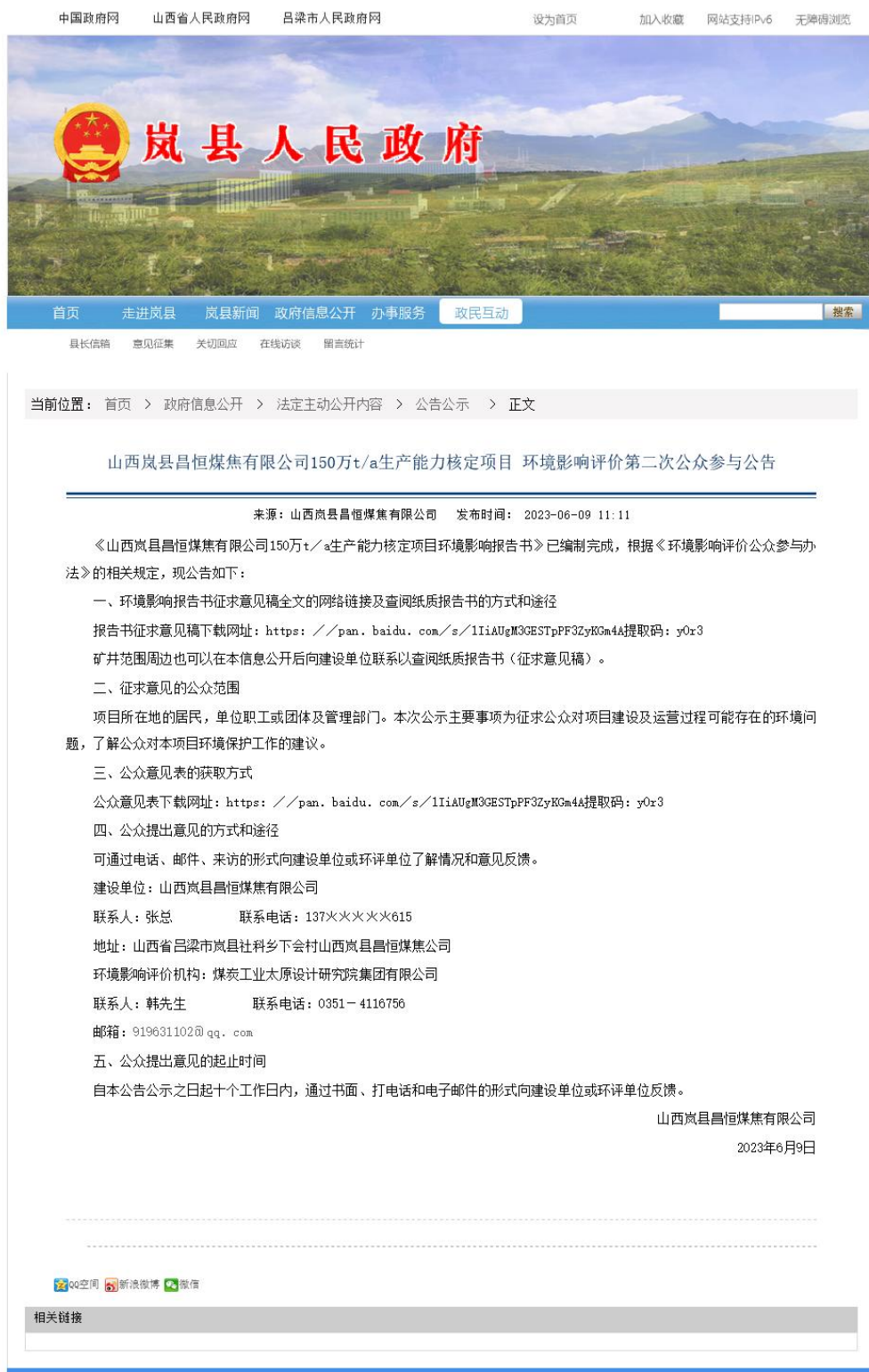
图 2 公众参与第二次信息公告网络公示截图