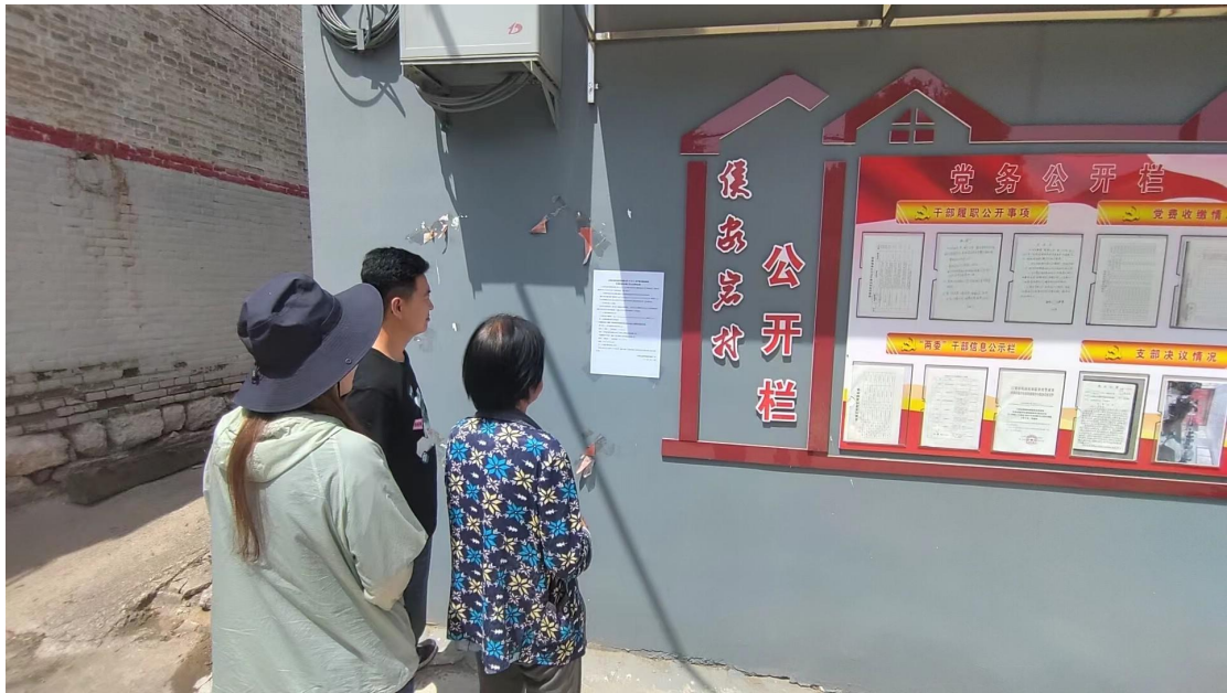
图5 公众参与第二次信息公告村庄张贴现场照片