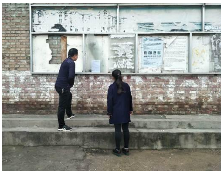
图 6 西安生张贴公示