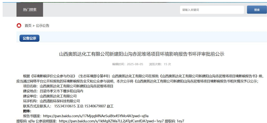
图7 审批前公示截图

本次全文公示网络载体为山西环保信息网，公示时间为2023年6月20日，公示载体及公示期限符合生态环境部令第4号《环境影响评价公众参与办法》。