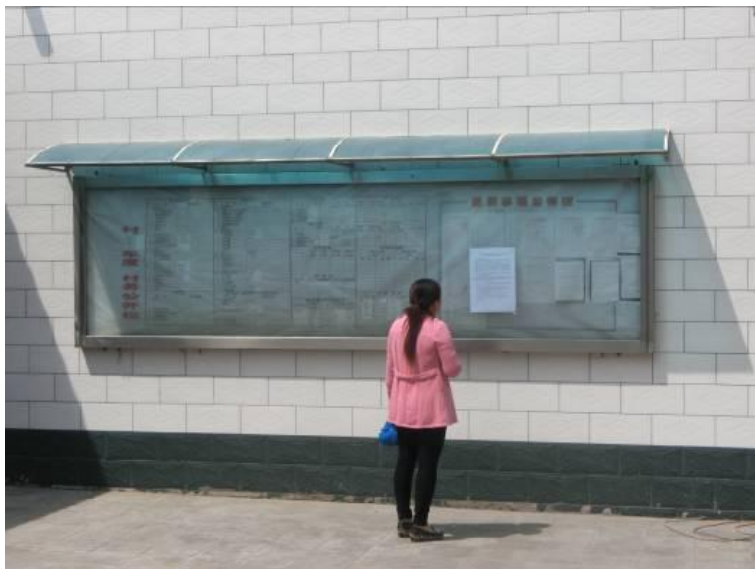
图 5 东安生 公示

于 2023 年 1 月 4 日~2023 年 1 月 5 日，西安生、东安生、兴跃村张贴了告示；张贴区域、时间符合生态环境部令第 4 号《环境影响评价公众参与办法》。张贴的公示照片见图 5~图 7。