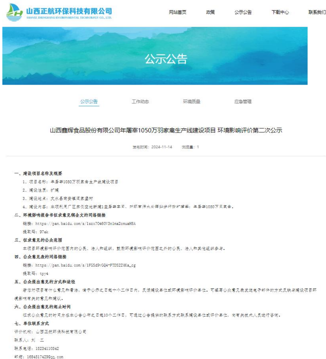
图 2 第二次网上公示截图