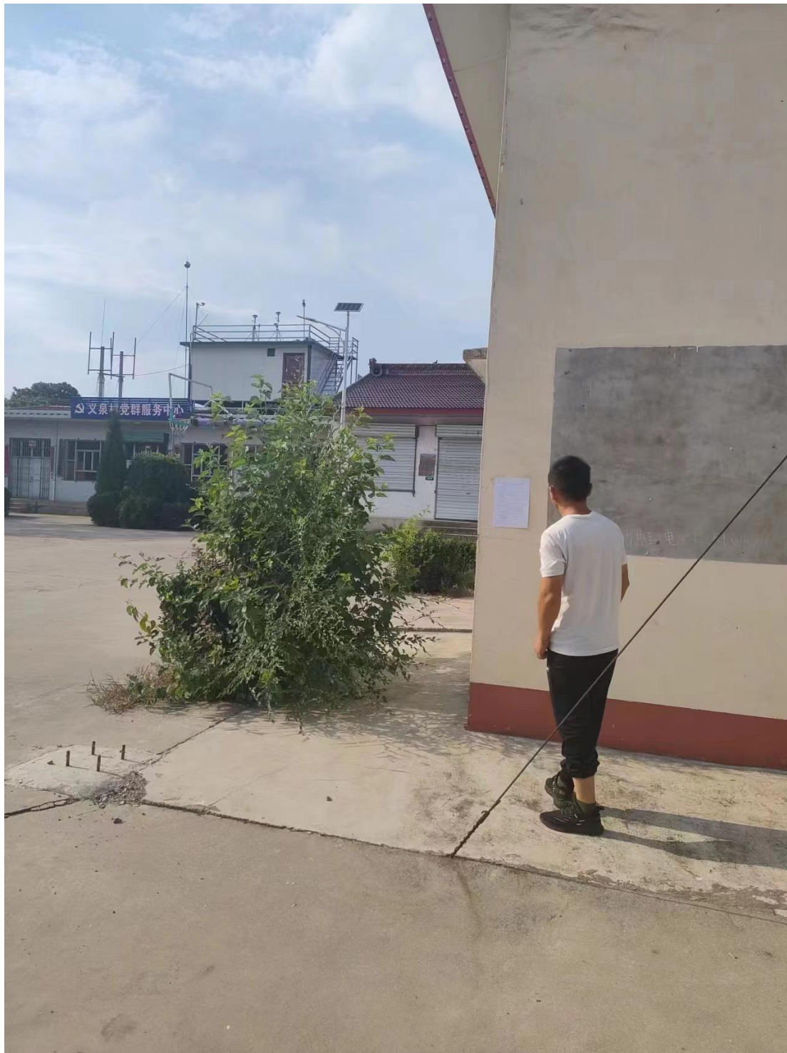
图 4 张贴公示照片

2024 年 11 月 14 日，建设单位闫家堡村进行了张贴公示。选取地点为离本项目最近的公众聚集场所。张贴时间不少于 10 个工作日。