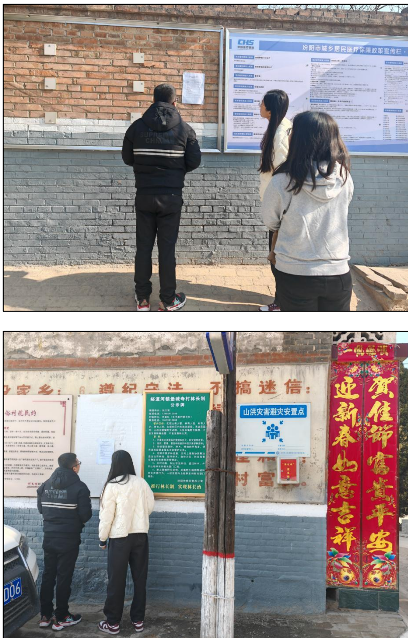
图 3-5 本项目环境影响评价第二次公示（张贴）