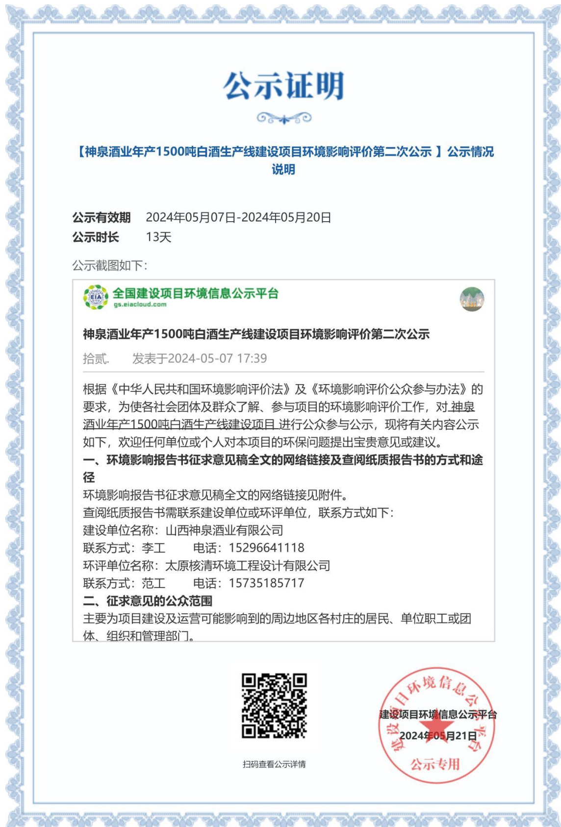
图 3-2 本项目环境影响评价第二次公示 公示证明