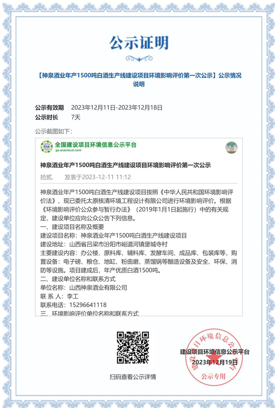
图 2-2 本项目环境影响评价第一次公示 公示证明