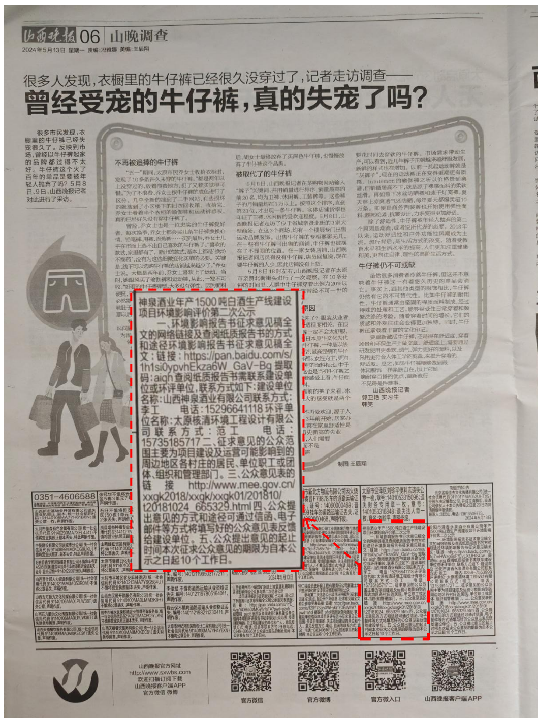
图 3-3 本项目环境影响评价第二次公示（报纸）