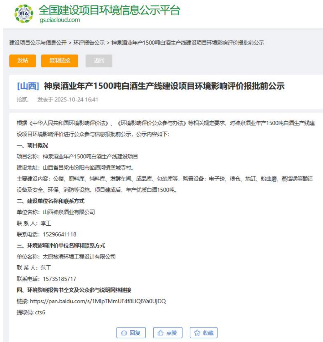
图 6-1 本项目环境影响评价报批前公示截图（网络）