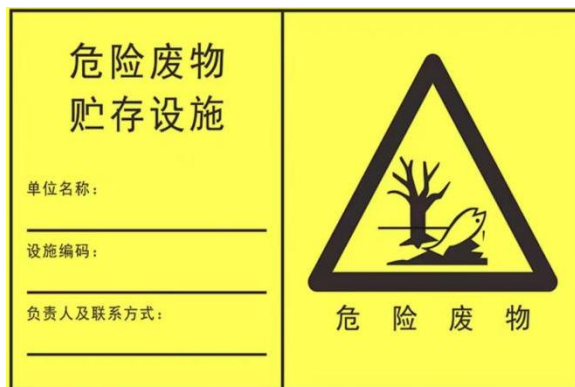
危险废物贮存设施标志