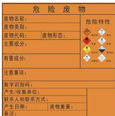
危险废物标签样式示意图

危险废物盛装容器上和危废贮存库外必须粘贴符合《危险废物识别标志设置技术规范》（HJ 1276-2022）的标签；危险废物贮存库不得接收未粘贴上述规定的标签或标签填写不规范的危险废物。