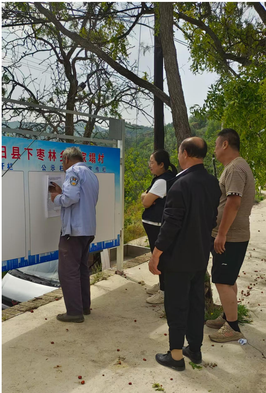
图 6 现场公示图