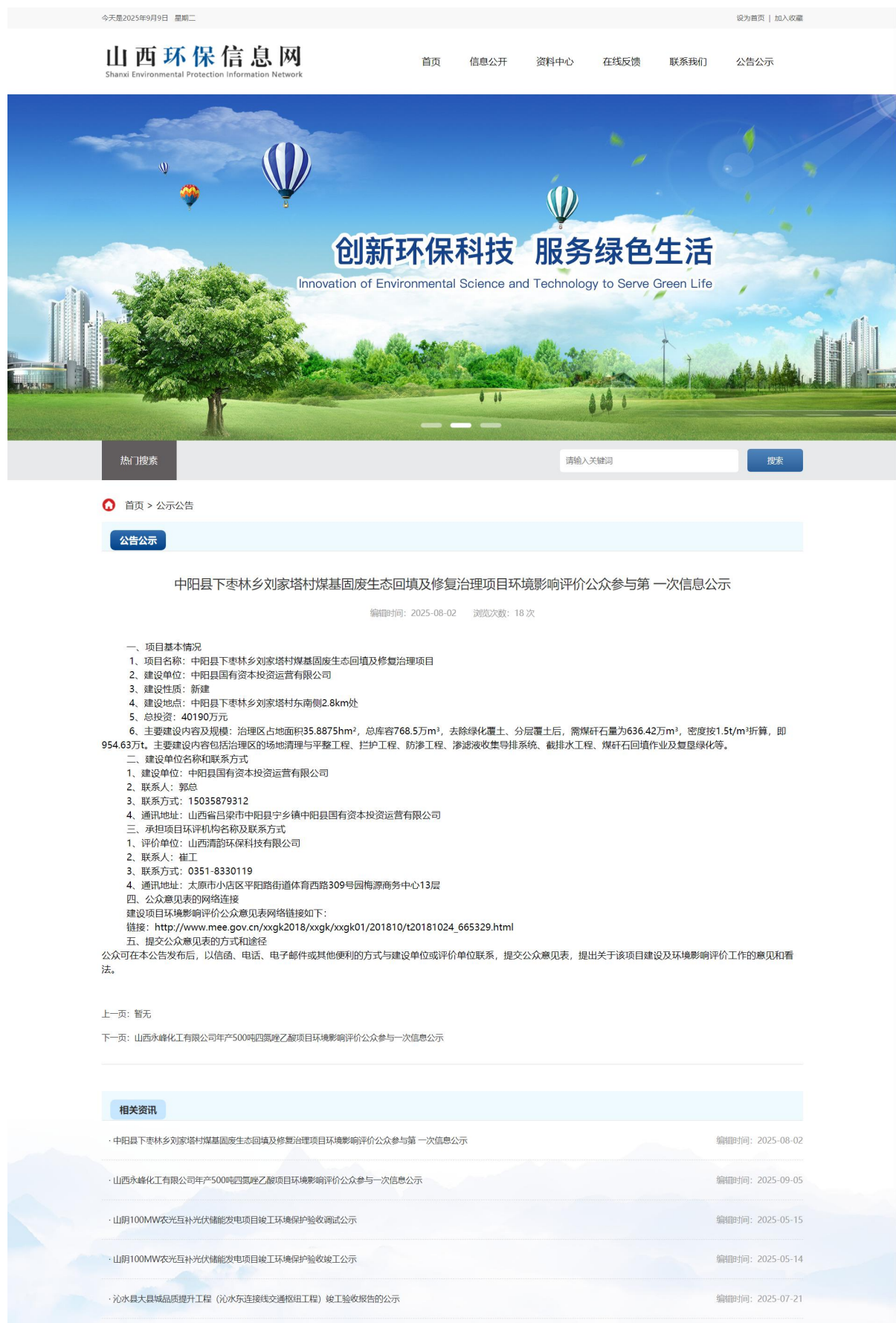
图 1 网络第一次公示