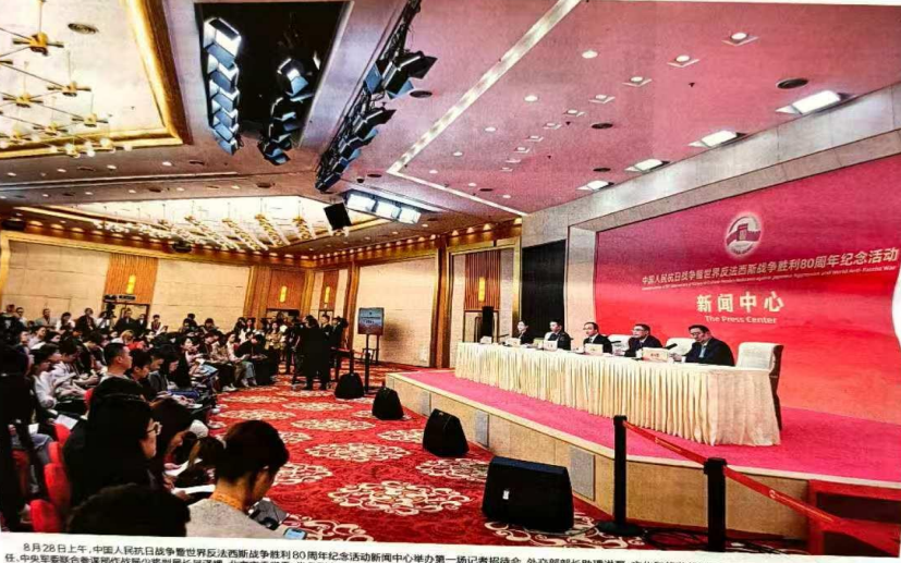
8月28日上午，中国人民抗日战争暨世界反法西斯战争胜利80周年纪念活动新闻中心举办首场记者招待会，外交部副部长洪磊、文化和旅游部副部长卢映川、阅兵领导小组办公室副主任任海江、中央军委联合参谋部战训部副部长黄泽峰、北京市委常委、常务副市长崔林茂介绍纪念活动有关情况，并回答记者提问。