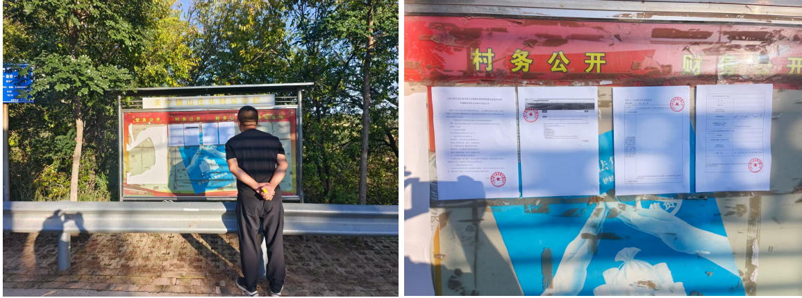
图 4-1 山庄头村公示

同期在项目周边当地村庄过村的公示栏张贴了本项目公示信息。当地村庄张贴照片见图 4。