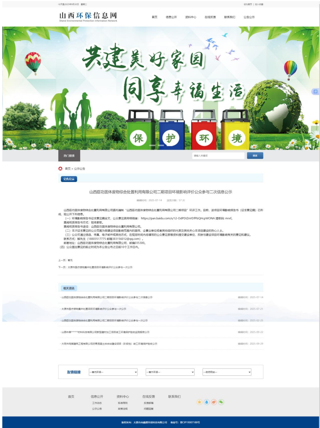
图 2 网站二次公示截图