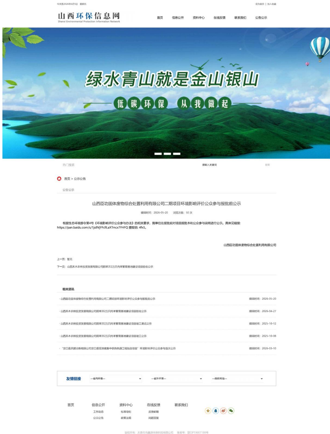
图 6 报批前公示截图