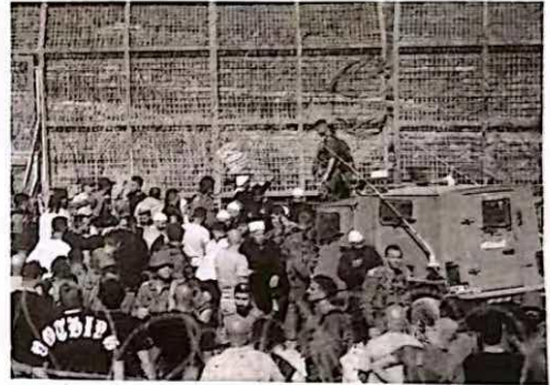
16日,在以色列占领的戈兰高地,以军士兵进行军事管控。

本月13日以来,叙利亚南部德意志人聚居的苏达省爆发武装冲突,造成大量人员伤亡。叙国防部门15日宣布,叙安全部队与苏达省地方代表达成协议,但此后冲突并未停止。以色列15日加大对叙政权武装的空袭力度,16日打击叙首都大马士革多处重要目标。此次叙利亚南部武装冲突因何而起?以色列为何介入?冲突如何收场?