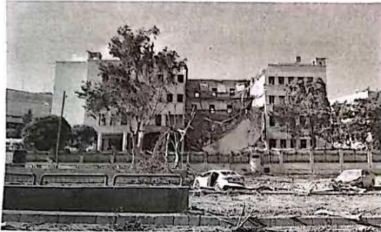
这是16日在叙利亚首都大马士革拍摄的在以色列空袭中受损的叙“总参谋部”大楼。

据新华社电 叙利亚政权领导人艾哈迈德·沙拉17日说,德意志人叙利亚社会不可分割的组成部分,保护他们的权利和自由是“我们的优先事项之一”。他指责以色列试图将叙利亚拖入战争,分裂叙利亚。