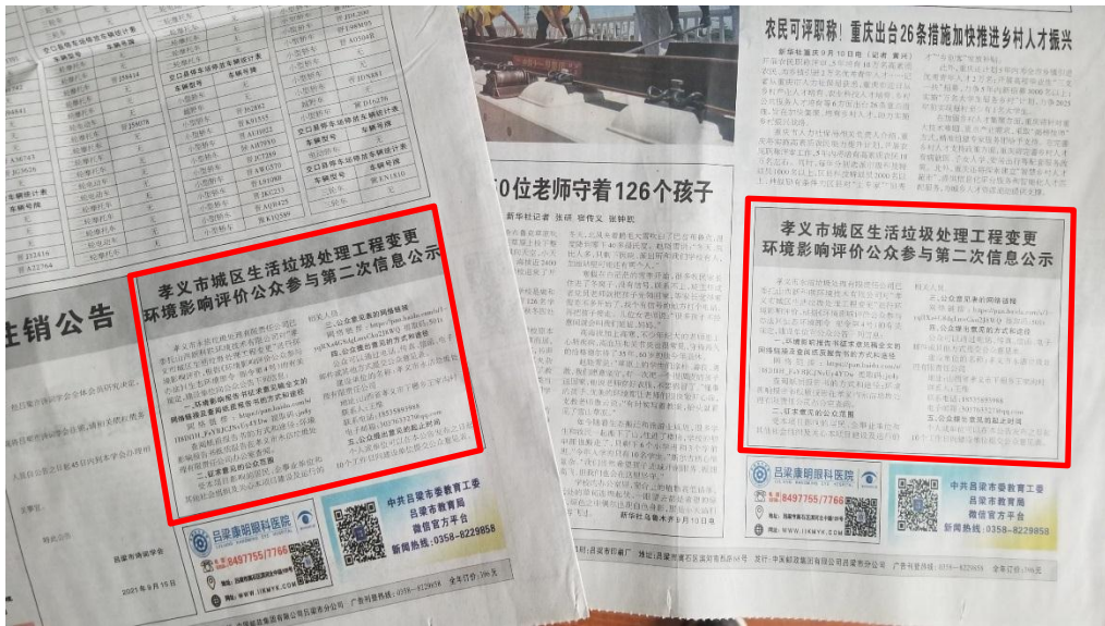
图 3-2 报纸公示

地区最优秀的日报之一，吕梁日报发行量近 1 万份、覆盖面广，在吕梁地区甚至整个国内日报中都具有重要影响。