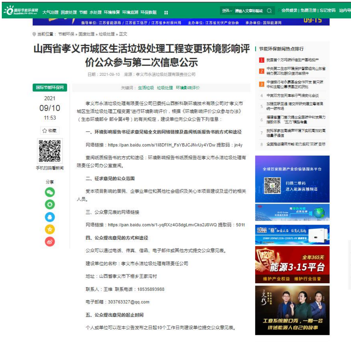
图 3-1 征求意见稿网络公示

建设单位于 2021 年 9 月 10 日在国际节能环保网中进行了二次公示 ( https://huanbao.in-en.com/html/huanbao-2342819.shtml ), 网络公示截图见图 3-1。