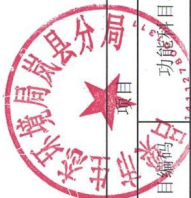
2022年预算收入汇总表