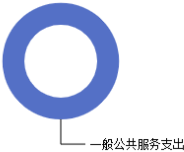
一般公共预算当年拨款结构图

2026年度吕梁市财政绩效考评中心一般公共预算安排基本支出148.83万元，其中：